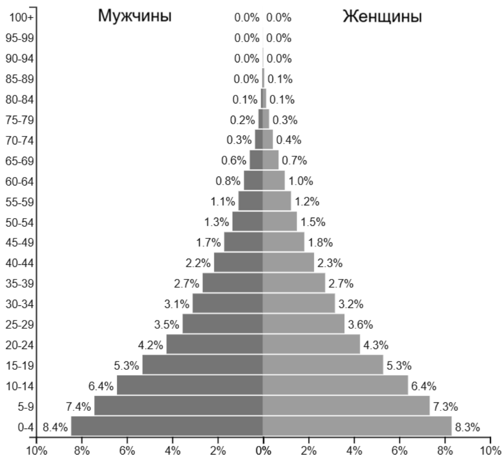
Половозрастная пирамида Анголы в 2024 г.

14 В каком регионе мира находится страна, о которой говорится в тексте?