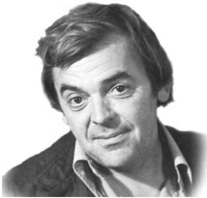
Юрий Иосифович Коваль (1938–1995)

Юрий Иосифович Коваль – один из самых ярких детских писателей XX века, его книги многократно переиздаются. У него был зоркий взгляд художника, ведь он и сам замечательно рисовал. Юрий Коваль умел останавливать мгновение, видя красоту, недоступную глазу обычного человека.