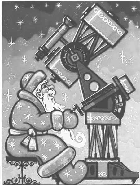
Рис. 1: Рисунок к задаче 6.

Изображенный на новогодней открытке Дед Мороз производит наблюдения в 00^h00^m истинного солнечного времени 1 января 2026 года. Определите примерные широту места наблюдения и координаты (прямое восхождение и склонение) наблюдаемого объекта, если известно, что наблюдения ведут в России. В каком созвездии находится наблюдаемый объект?