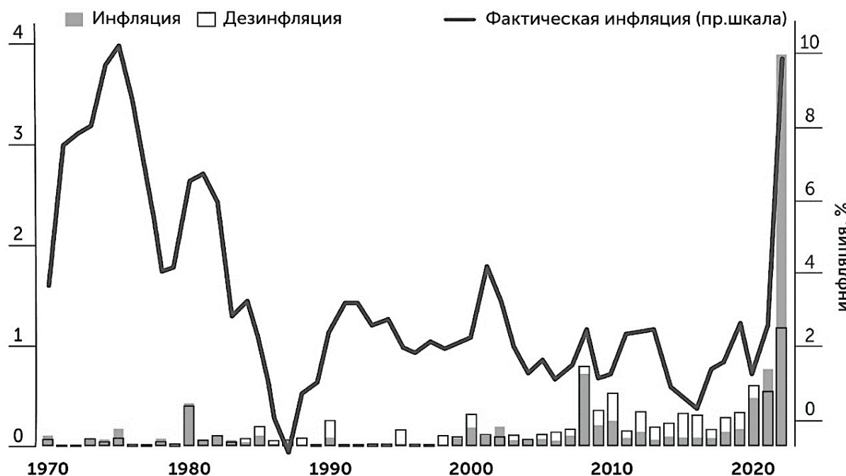
Рисунок 1. Периоды инфляции и дезинфляции, которые вспомнили респонденты, и фактический уровень роста цен

* % вспомнивших инфляцию – закрашенная часть столбика, % вспомнивших дезинфляцию – белая часть столбика.