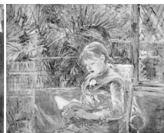
Берта Моризо «Чтение»