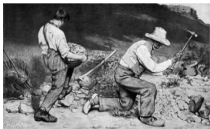
Гюстав Курбе «Дробильщики камня»

2.1. Из представленных ниже репродукций картин выдающихся французских художников выберите ту, на которой изображено протекание химической реакции.