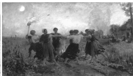
Жюль Бретон «День Святого Иоанна»