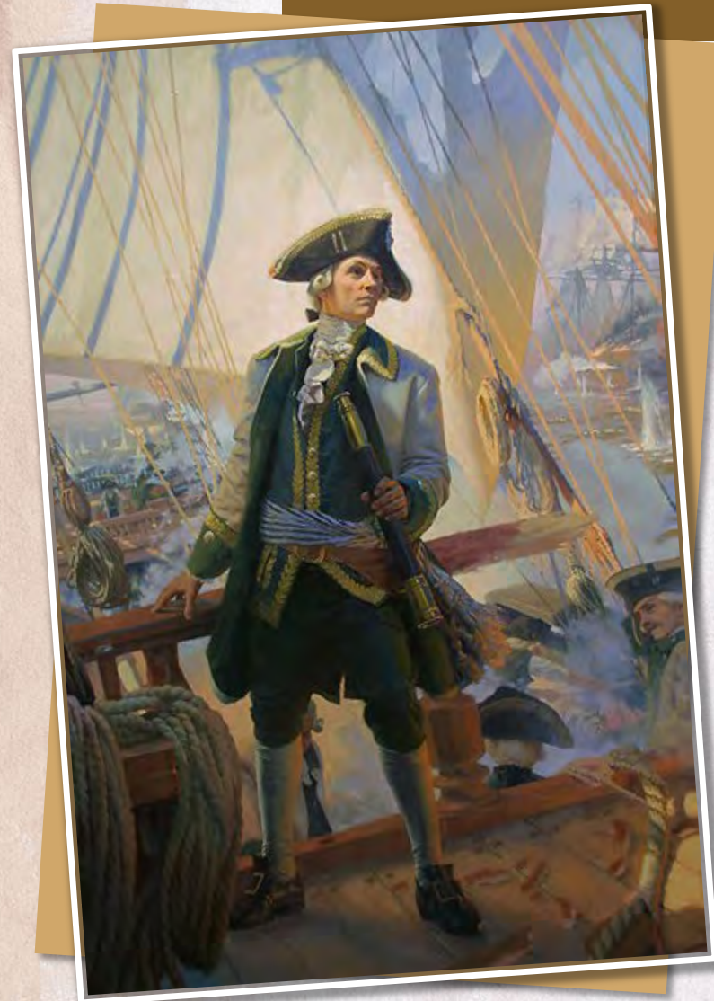
«Ушаков флотоводец», Н. Г. Николаев