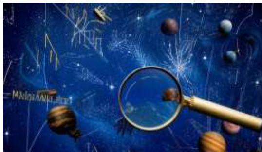
Изображение сгенерировано моделью Kandinsky 3.1