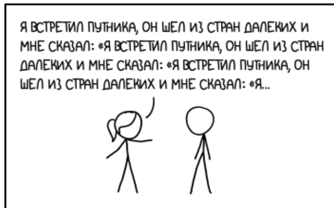
Шутка по теме задачи 3

Очень быстрый самолёт летит вдоль экватора Земли с запада на восток. Длина окружности земного экватора – около 40 тысяч километров.