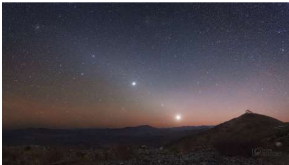
Планеты Венера, Марс и Юпитер на предрассветном небе 2

Посмотрите внимательно на «групповой портрет» Солнечной системы. В одну цепочку на снимке выстроились планеты Венера, Марс и Юпитер, а также звезда Регул ( \alpha Льва).