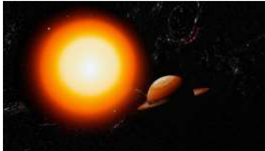
Изображение сгенерировано моделью Kandinsky 3.1

Планеты А и Б обращаются вокруг красного карлика по круговым орбитам в одной плоскости и в одном направлении. Периоды обращения планет равны 1 земному году и 3 земным годам соответственно.