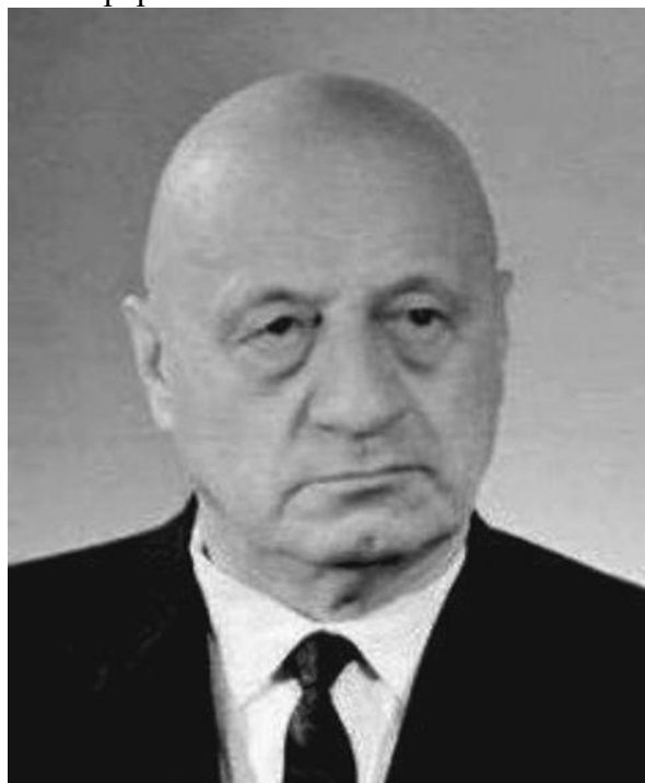
9.2. Портрет 2.