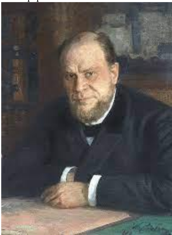
9.1. Портрет 1.