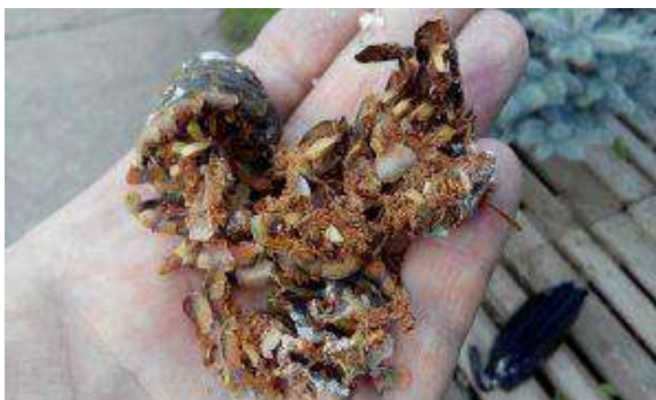
Шишка, повреждённая шишковой огнёвкой

Шишковая огнёвка повреждает шишки разных хвойных пород деревьев и их молодые побеги. После рождения гусеницы вгрызаются в шишки и развиваются там. Часто их можно встретить внутри молодых побегов елей и сосен, где они протачивают ходы. К каким последствиям может привести вспышка численности шишковой огнёвки на данном участке елового леса?