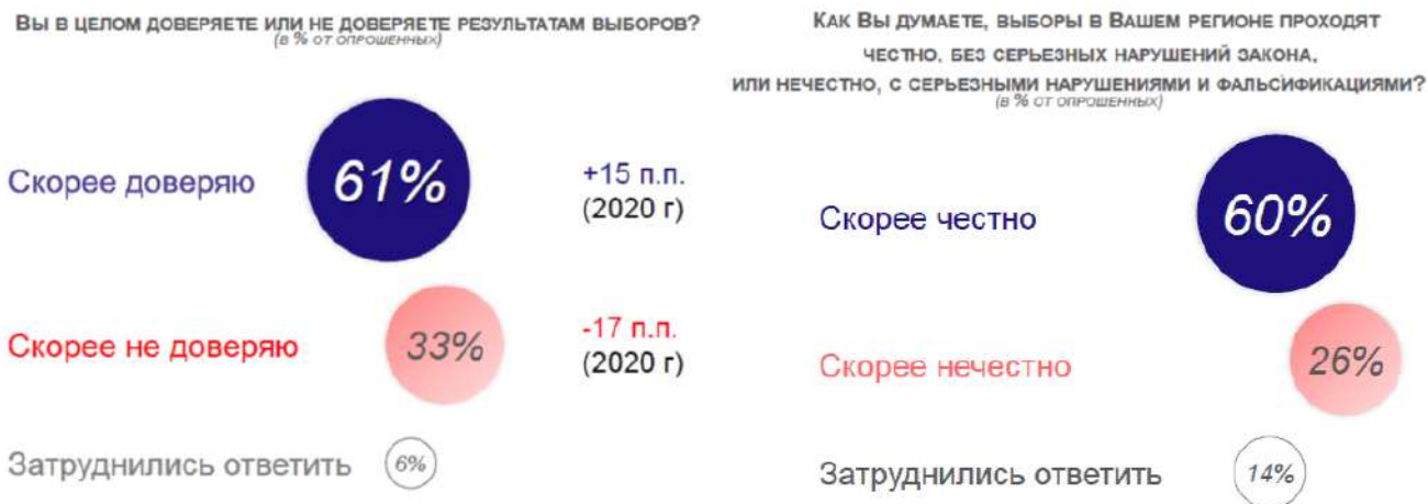
Рисунок 2. Распределение ответов на вопросы о доверии и честности выборов (в % от опрошенных)

15.1. Какой тип социального поведения исследовался социологами? Укажите его социологическое название.