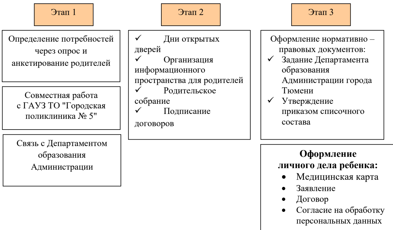
Рис. 3. «Этапы организации детей КМП»

С целью изучения степени удовлетворенности родителей качеством образовательных услуг консультационно – методического пункта, предоставляемых дошкольным образовательным учреждением, условиями пребывания их детей в детском саду, с целью выявления мнения родителей о получении образовательных услуг, а также возможные пожелания предусмотрено проведение социологического исследования удовлетворенности родителей качеством услуг консультационно – методического пункта, предоставляемых образовательным учреждением в периодичности 1 раз в квартал средствами анкетирования.