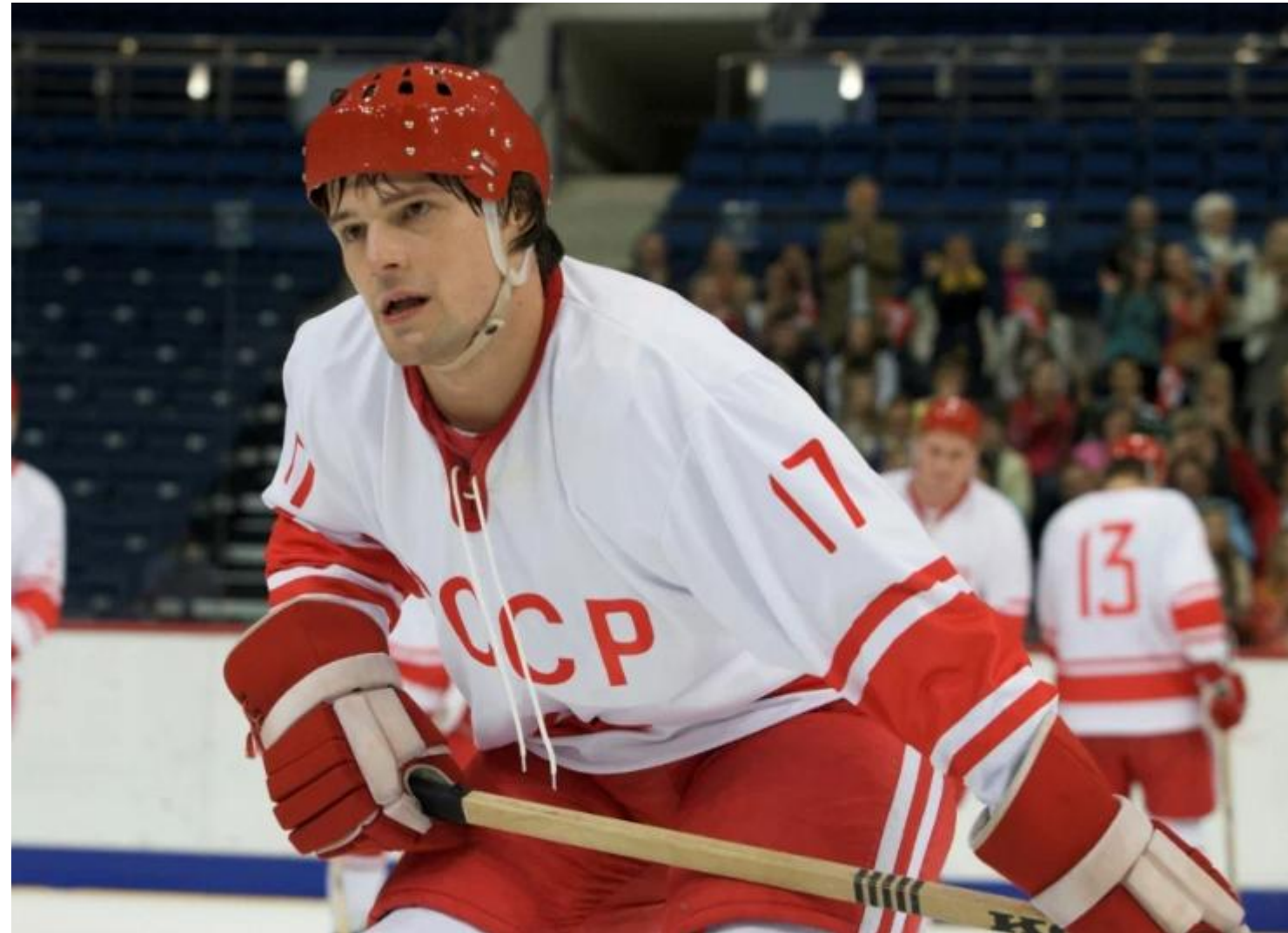
Данила Козловский для роли Валерия Харламова в знаменитой «Легенде 17» несколько месяцев учился с профессиональными тренерами кататься на коньках и владеть хоккейной шайбой