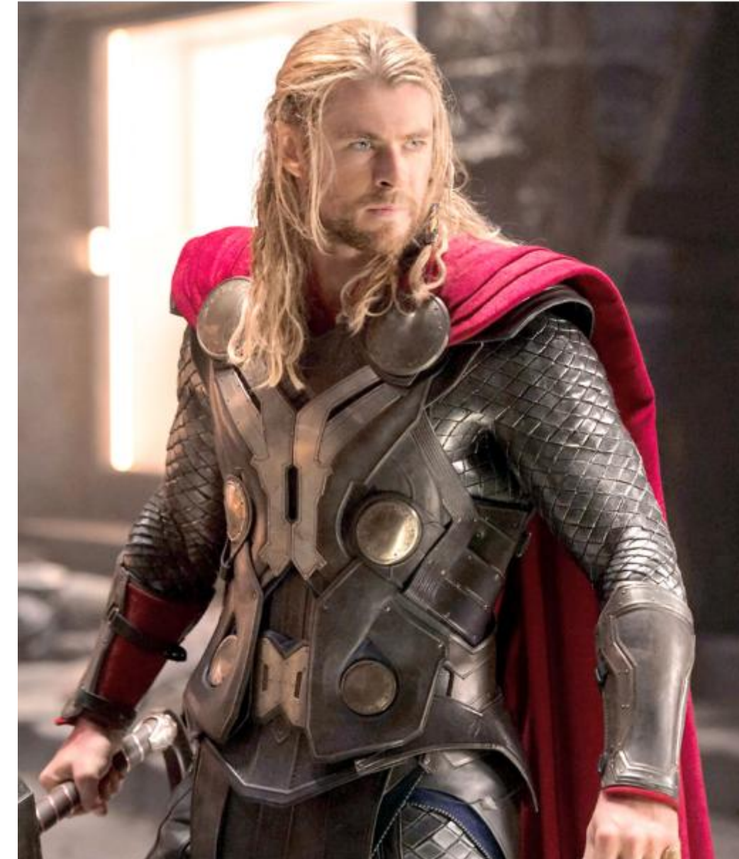
Крис Хемсворт для роли Тора за полгода набрал 18 кг мышечной массы