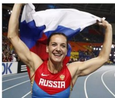
Рекордный прыжок Елены Исинбаевой