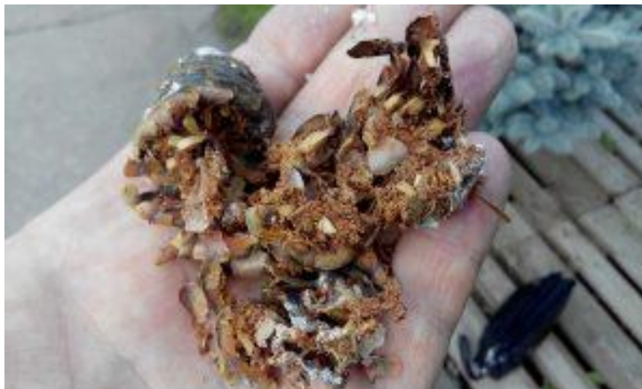
Шишка, повреждённая шишковой огнёвкой

Шишковая огнёвка повреждает шишки разных хвойных пород деревьев и их молодые побеги. После рождения гусеницы вгрызаются в шишки и развиваются там. Часто их можно встретить внутри молодых побегов елей и сосен, где они протачивают ходы. К каким последствиям может привести вспышка численности шишковой огнёвки на данном участке елового леса?