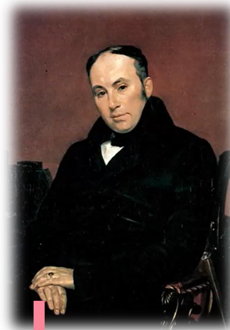
Жуковский Василий Андреевич