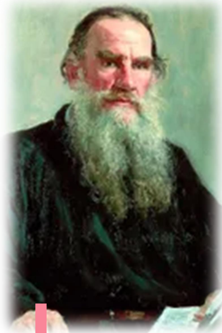
Толстой Лев Николаевич