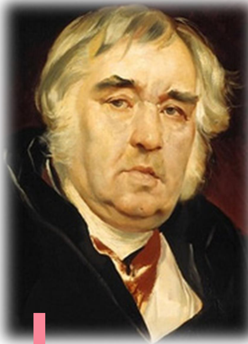
Крылов Иван Андреевич