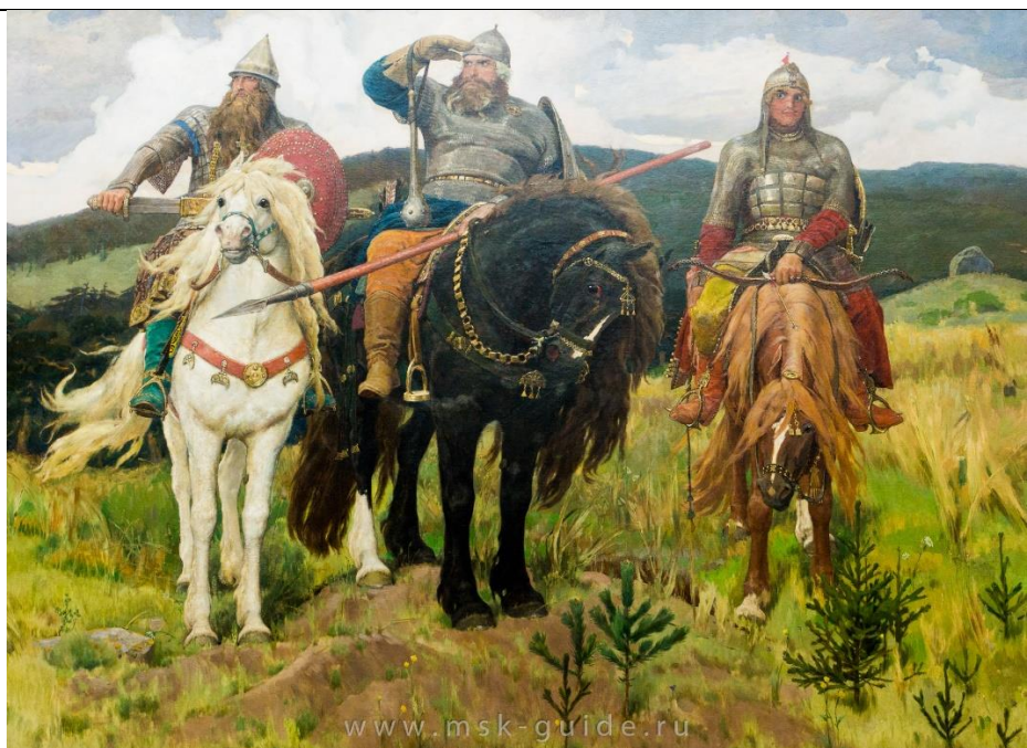
илл. № 2