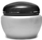
Крем для лица