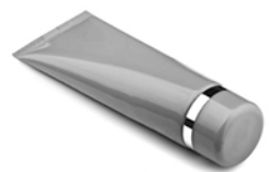
Крем для рук