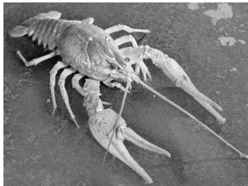
А. _____ Б. _____