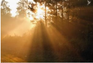
А Солнце в тумане

1. На какой из фотографий из-за специального метода съёмки изображение солнца получилось не таким, каким оно выглядело на самом деле, но зато больше напоминающим привычную звезду?