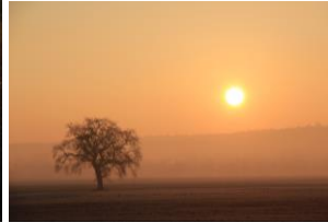
Б Восход солнца