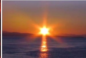
Г Закат солнца

2. Какое свойство есть у северного сияния?