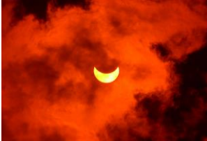
В Солнечное затмение