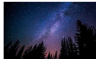
Г Звёздное небо