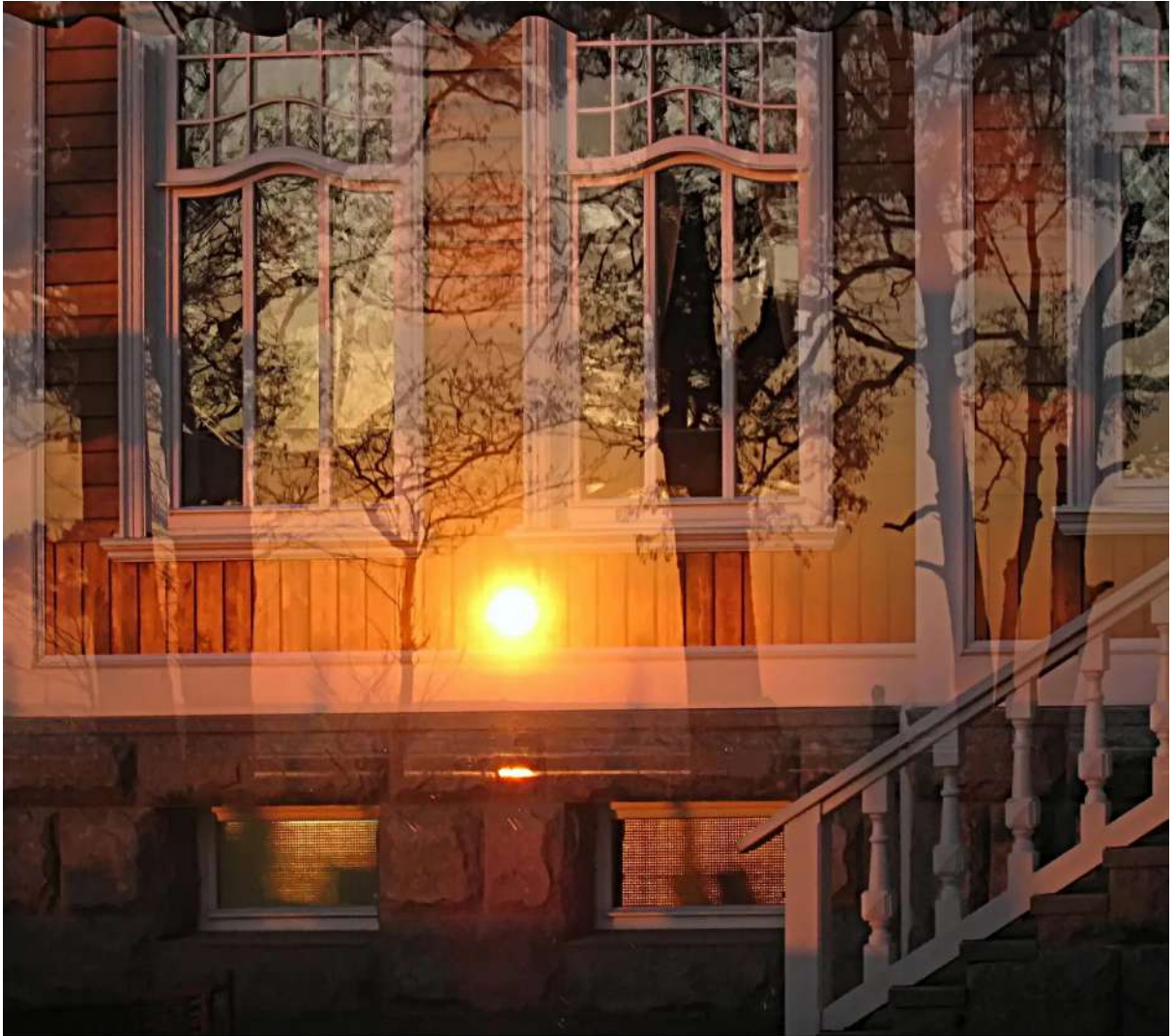
Рис.1 Солнечный зайчик на стене дома.

Ученик школы Петров проводит астрономический эксперимент в день осеннего равноденствия в северном полушарии Земли - пускает зайчики плоским зеркалом своей одноклассницы Сидоровой на стену противоположного школе здания. Зайчик на стене здания оказывается точно на уровне окна школы, откуда Петров проводит свой “эксперимент”. Помогите Петрову ответить на следующие после условия вопросы, если известно два факта: