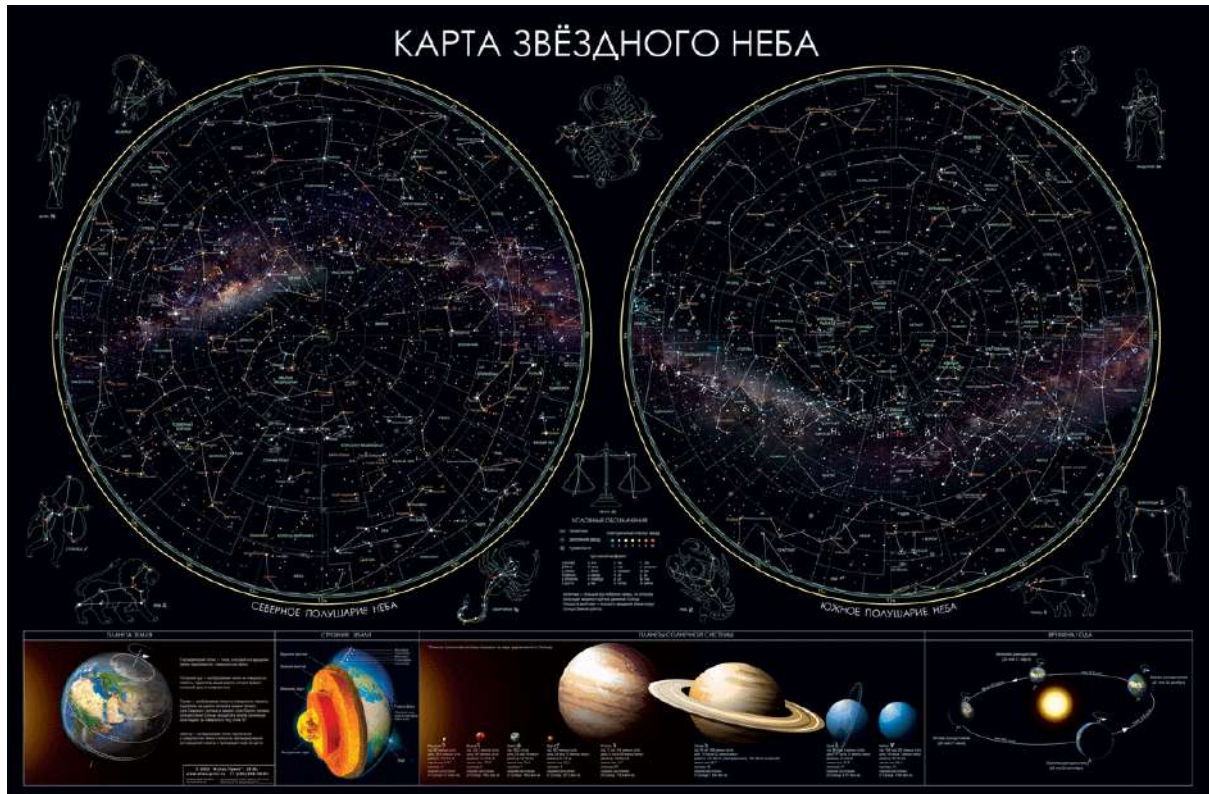
Рис.1 Пример карты звездного неба

Известно, что в течении года Солнце перемещается по звездному небу. Движение Солнца по небу происходит в направлении востока, и за год оно замыкает на небе полный круг, который называется эклиптика. В своем пути этот круг проходит через созвездия звездного неба. Отметьте какие из перечисленных созвездий посещает солнечный диск в своем пути по небу за год?