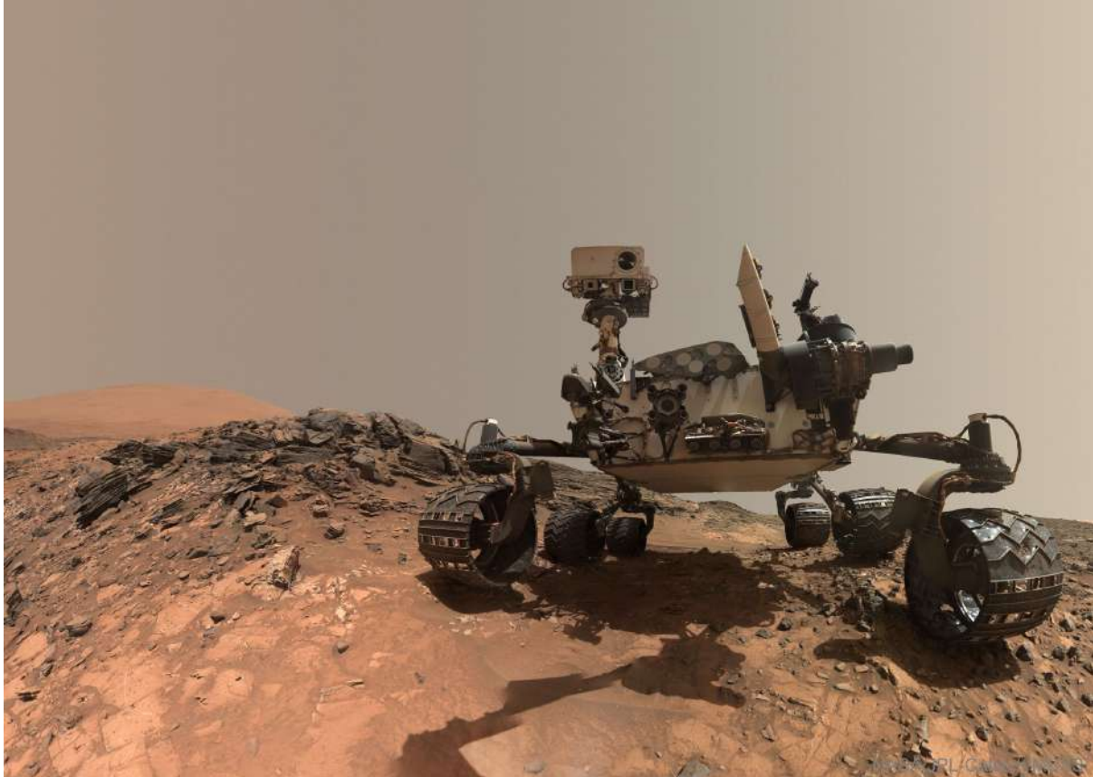
Рис.1 Селфи фотография марсохода “Любопытство” на Марсе в 2017 году.

В последние годы на Марс было отправлено большое количество марсоходов, которые занимаются исследованием поверхности “красной” планеты. Сигналы, отправляемые аппаратами по радиосвязи, распространяются со скоростью света. Известно, что свет от Солнца до Земли идет 500 секунд, а сигнал от марсохода до Земли - 10.6 минуты.