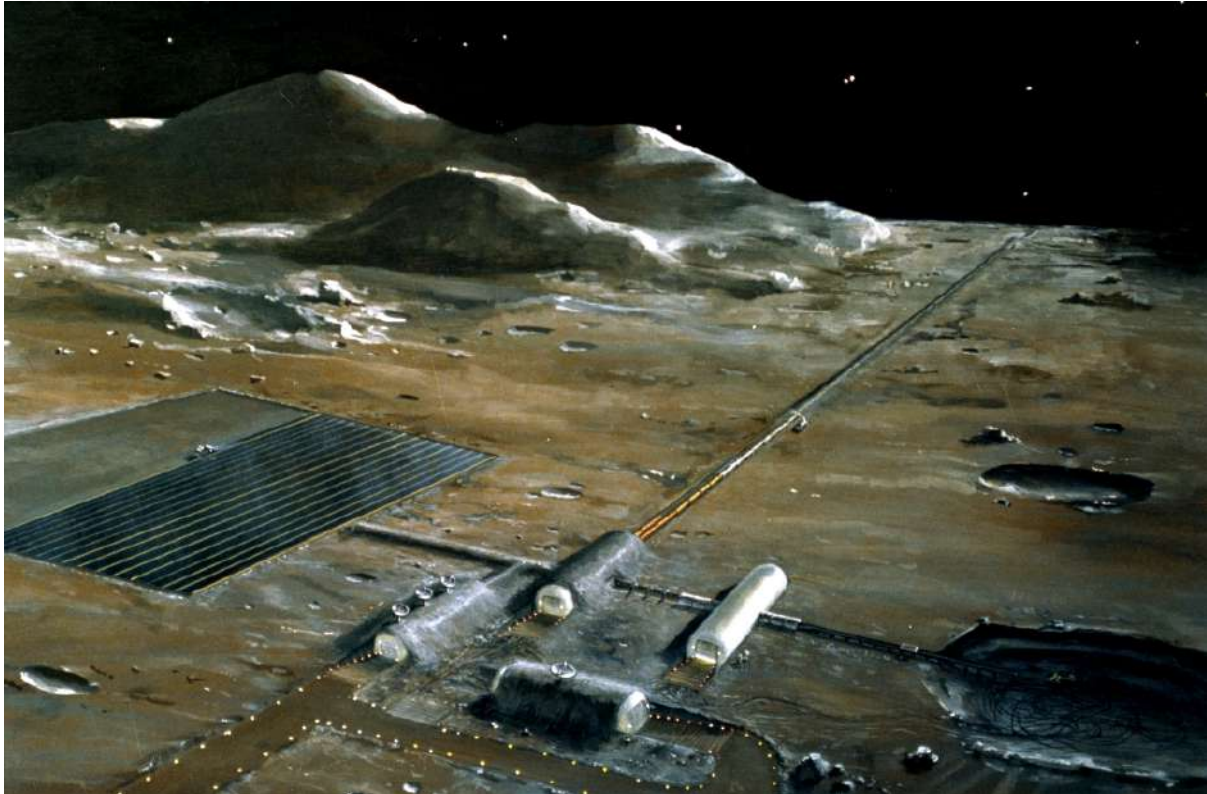
Рис.1 Проект Лунной базы, нарисованный художником

В недалеком будущем к 2030 году “Роскосмос” планирует строительство лунной базы и лунной обсерватории. Представим, что для удобства связи станцию разместили в центре видимого с Земли полушария Луны.