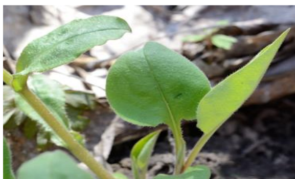
А) весенняя генерация листьев

У медуницы неясной – раннецветущего растения широколиственных лесов – есть две генерации листьев: весенняя и летняя. Они по-разному реагируют на изменение уровня освещённости. Какая кривая интенсивности фотосинтеза № 1 и № 2 соответствует листьям медуницы неясной на фотографиях А и Б.