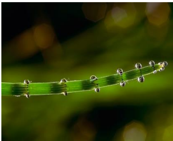
Пример гуттации у хвоща

Гуттация (от лат. gutta – «капля») – процесс выведения воды в виде капель жидкости на поверхности растений водяными устьицами, когда транспирация затруднена. В каких условиях гуттация наиболее вероятна?