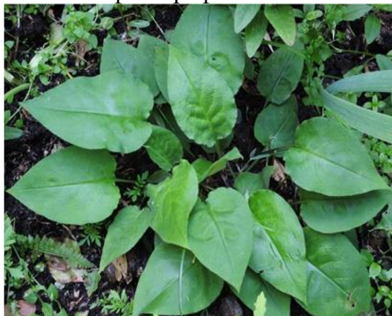
Б) летняя генерация листьев