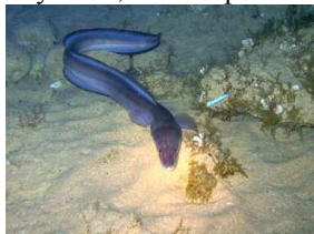
1) Морской угорь

8) Расположи изображения морских организмов в порядке увеличения глубины, на которой они обитают: