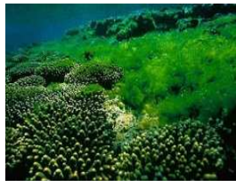
3) Морские водоросли

Запиши цифры, которыми обозначены морские организмы, в клеточки в нужной последовательности.