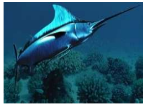
2) Рыба меч