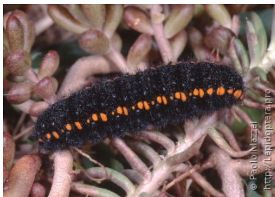
Гусеница на очитке (сем. Толстянковые)