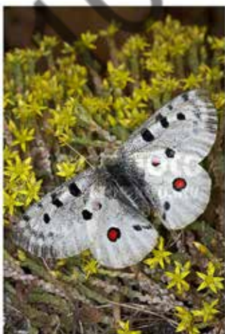
Аполлон обыкновенный на Очитке едком

Аполлон обыкновенный – представитель семейства Парусников отряда Чешуекрылых. Места обитания: луга, горные луга, степи, открытые пространства. Кормовые растения гусениц – виды семейства Толстянковых (суккуленты родов Очиток и Молодило). Зимуют новорожденные гусеницы, находясь в оболочке яйца, у некоторых подвидов – вне оболочки. Известны случаи досрочного выхода зимующих гусениц из яйца при сильных оттепелях зимой и ранней весной. Вид обладает слабой способностью к миграциям при сильно удалённых друг от друга популяциях.